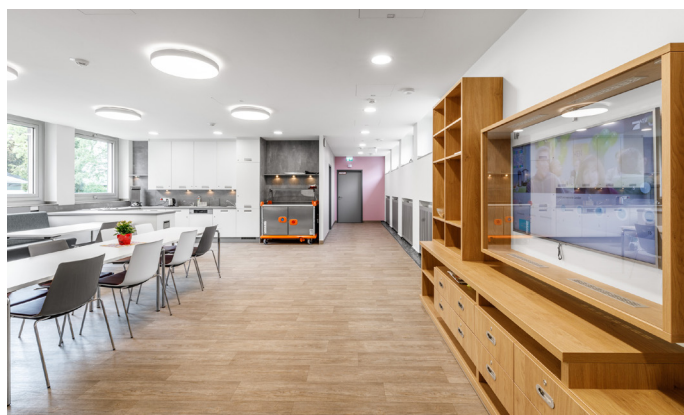
Baumaßnahmen im Fliedner Krankenhaus Ratingen auf geschützter Station abgeschlossen (oben). Outdoor-Sportgeräte erweitern Therapiekonzepte (unten).

Bereits seit letztem Jahr wird eine der früher zwei geschützten Stationen des Fliedner Krankenhauses gänzlich offen geführt. Die umfangreichen Umbaumaßnahmen werten nun auch den neuen geschützten Bereich auf. Ziel war es, bei reduzierter Bettenzahl eine lichte und offene Architektur zu schaffen - unter Einbeziehung von Therapie- und Entspannungsräumen und einem großen geschützten Gartenbereich mit Outdoor-Sportgeräten. „Wir wissen, dass eine offene Architektur Gewalt reduzieren kann.“, erklärt Chefarzt Maximilian Meessen. „Die erste Resonanz der Patienten ist sehr positiv!“